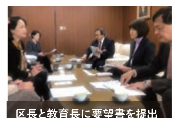
区長と教育長に要望書を提出