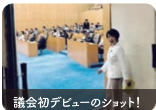
議会初デビューのショット!

人生初の議会質問!得意分野の「子育て支援」や、「保育の質」「退園ルール撤廃」について伺いました。